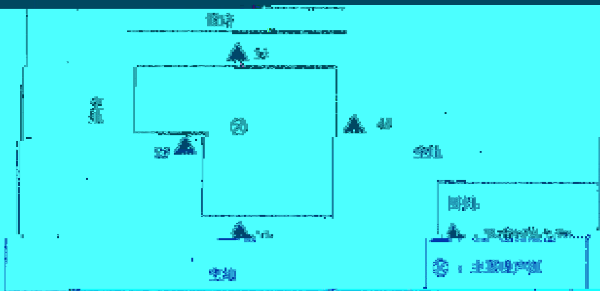
附图：项目噪声检测点位示意图。